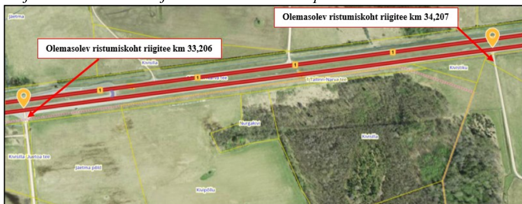
Joonis 3. Väljavõte Maa-ameti teeregistrist

Väljavõte 28.11.2024 kirja nr 7.1-2/24/18971-4 p 2