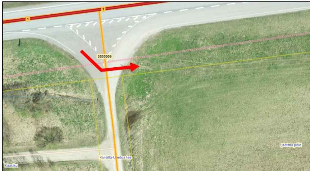
Joonis 4. Väljavõte Maa-ameti kaardirakendusest

Kuna joonisel 4 näidatud lahenduse kohaselt hakkavad olemasoleva riigitee ristumiskoha km 33,206 ja Kivisilla-Uuetoa tee nr 3530009 kavandatava ristumiskoha pöörderaadiused kattuma ning suundristmiku parameetrid ei võimalda sooritada liiklusseaduse kohaseid manöövreid (näiteks seetõttu, et pööre tehakse ca 40 km/h kiirusega), siis ei sobi lahendus suundristmiku liikluskorraldusse.